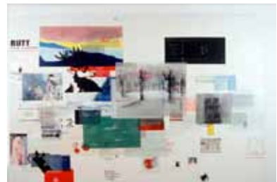
Miltos Manetas - 'on, june 2007'

Ikzelf werd ook erg geïntrigeerd door dit werk, ik heb altijd een interesse gehad in het vereeuwiggen van informatie die zich op het internet bevindt, op die manier heb ik ook een aantal opdrachten op de academie aangepakt. Waar je altijd tegenaan loopt is de vraag of de beweeglijkheid van het internet inderdaad duidelijk zichtbaar moet zijn in het werk. Bij de Internet Paintings van Manetas is het overduidelijk dat het over het internet gaat, ten eerste omdat hij letterlijke websites gebruikt in het werk en ten tweede omdat de schilderijen altijd in beweging en verandering blijven. Een opdracht die ik ooit heb gemaakt in het tweede jaar van de academie ging over de veranderlijkheid van wikipedia pagina's, elke verandering op elke pagina werd op een bepaalde manier in een bepaald format verwerkt en geprint, zo zou er uiteindelijk een grote stapel papier met alle minuscule veranderingen ontstaan. Dit laat vooral de hoeveelheid en de enorme beweeglijkheid zien door de hoeveelheid prints die er ontstaan. Uiteindelijk is dat denk ik toch één van de beste manieren om deze massa communicatie te vertalen naar print, door de veelheid te laten zien. Net zoals Manetas dat in zijn schilderijen doet. De veelheid doet het 'm toch. Zo heb ik ook nog een keer een andere opdracht gedaan over de G8, waarbij ik Google als grote informatiebron gebruikte. Door middel van zoektermen zocht ik uit waar elk G8-land zich het