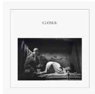
Peter Saville - Joy Division platenhoes