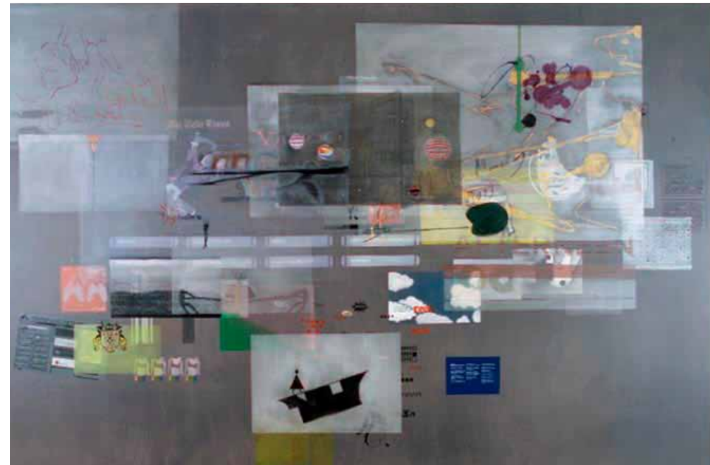
Miltos Manetas - 'off, june 2007'

op het moment dat het vereeuwigd wordt wel degelijk. Op zijn website wordt het omschreven als: