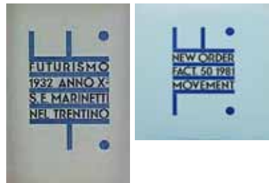
Peter Saville / Fortunato Depero